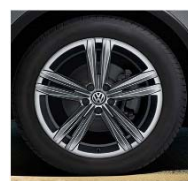
Sebring Grey Metallic