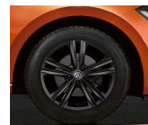
Sebring Black (Black Style-paketti)