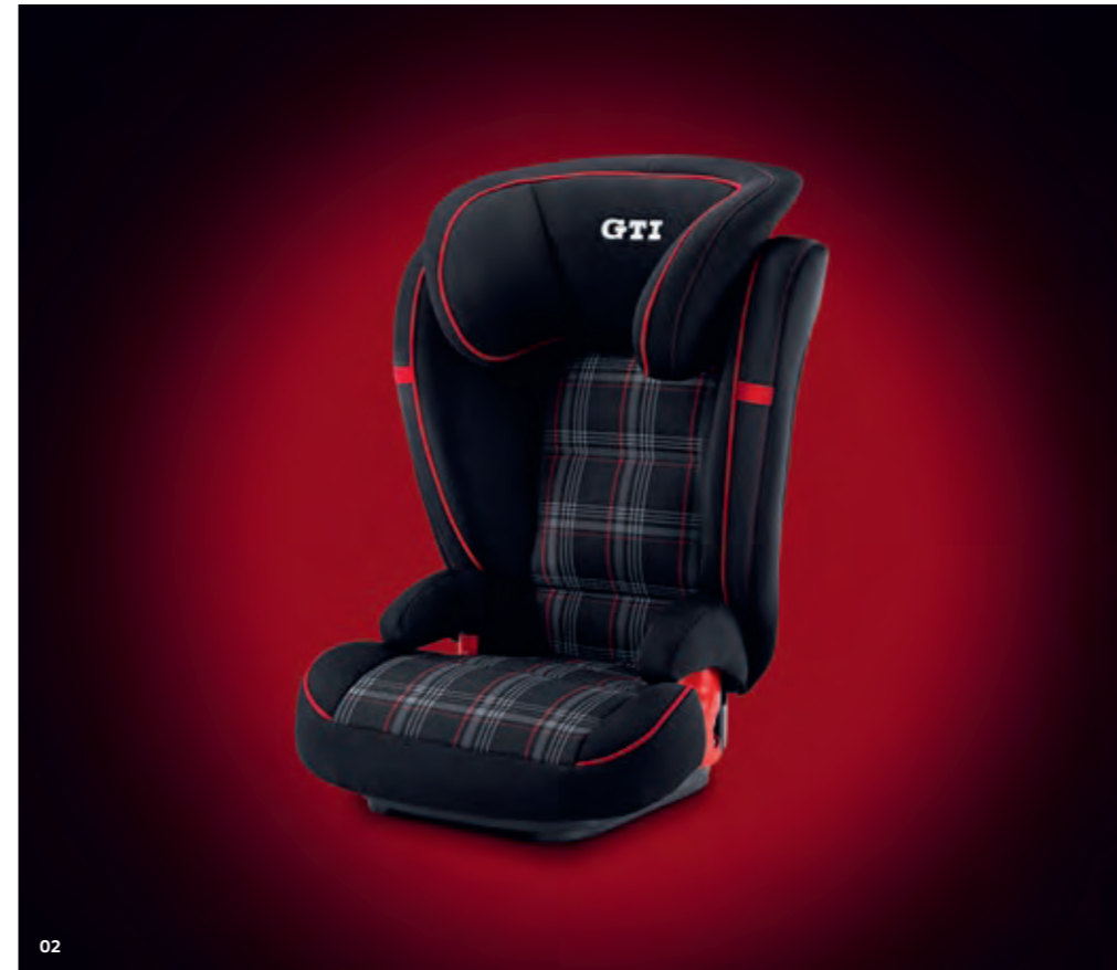
02 Kuin tehty pienille kilpakuskeille: Volkswagenin optimoitu alkuperäinen lisävaruste on turvaistuin G2-3 ISOFIT . Alkuperäinen GTI-muotoilu sopii mainosti 3-12-vuotiaille lapsille (15-36 kg). Turvaistuimesa on istuinosa, selkänoja ja säädettävä päätuki. Erikoismuotoillun pääosan, pitkälle eteen kaartuvien istuimen reunaosien ja hartia-alueen täydellinen tuki tarjoavat erinomaista matkustusmukavuutta ja turvallisuutta sivutörmäyksessä niin pienemmille kuin hieman suuremmillekin lapsille. Istuimen korkeutta ja kallistusta voi säätää.