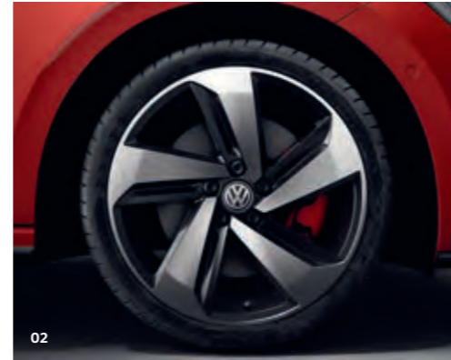
01 18 tuuman kevytmetallivanteet Brescia , Volkswagen R 02 17 tuuman kevytmetallivanteet Milton Keynes