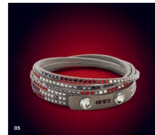
05 Kimallusta sen olla pitää: kierrerranneke GTI-koelmasta sisältää alkuperäisiä Swarovskin kristalleja kirkkaana, punaisena ja antrasiitinharmaana. GTI-teksti painonappien välissä.