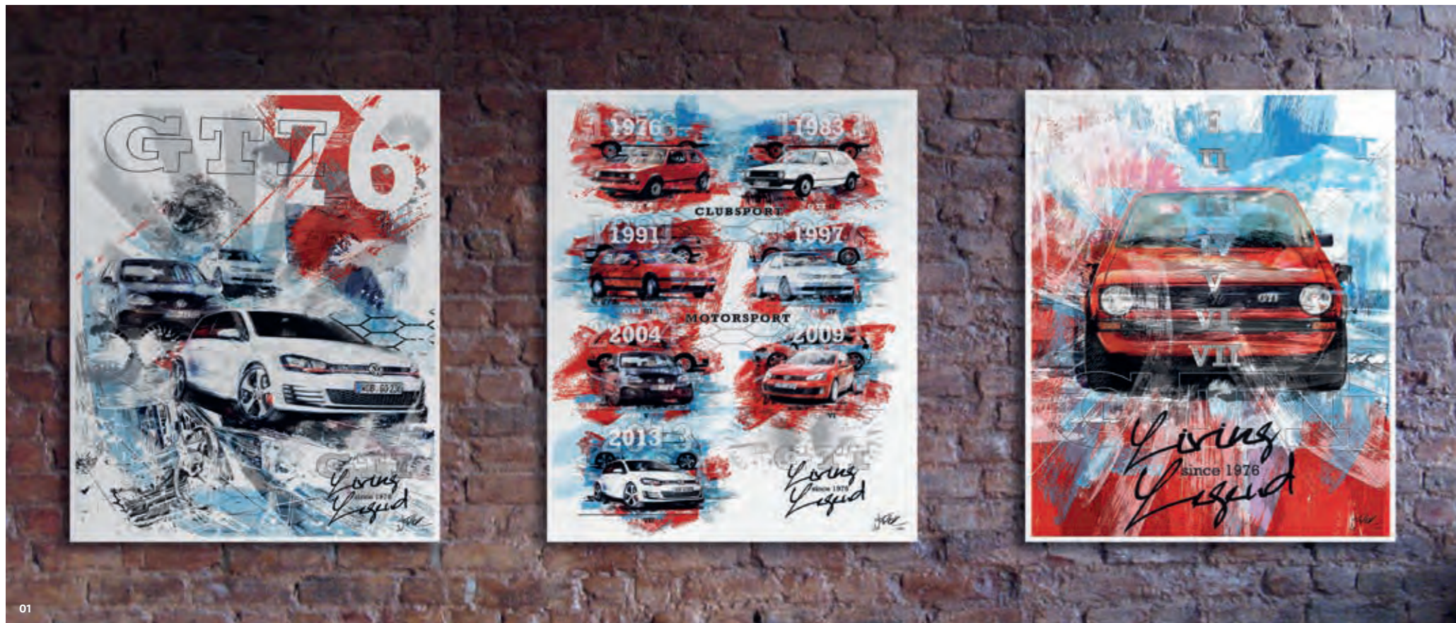
01 Suurta taidetta: näistä kolmesta taideteoksesta on saatavissa rajoitettu 1976 kappaleen painos Golf GTI:n 40-vuotisjuhlan kunniaksi. Ne kuvaavat GTI:n eri sukupolvia, ja ne toimitetaan mustassa paperirullassa todistuksen kanssa. Kuvissa on I-VII sukupolvien ensi- ja erikoismalleja.